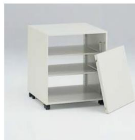
▲脱着式バックパネル

外形サイズ：W520×D450×H620mm (15.5kg) 棚板サイズ：W484×D395×H15mm 梱包サイズ：W540×D460×H630mm (16.5kg) 付属品：可動式棚板(2枚)、脱着式バックパネル、 キャスター(4個)、アジャスター(4個)